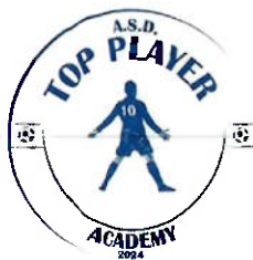
FIG.C.-L.N.D.-S.G.S. DELEGAZIONE PROVINCIALE DI TORINO Via Tiziano Vecellio, 8 10126 Torino

PER QUANTO NON PREVISTO DAL PRESENTE REGOLAMENTO, VALGONO LE DISPOSIZIONI DEI REGOLAMENTI FEDERALI IN QUANTO COMPATIBILI, E QUELLE RIPORTATE SUL COMUNICATO UFFICIALE N°1 DEL SETTORE GIOVANILE E SCOLASTICO RELATIVO ALLA STAGIONE SPORTIVA IN CORSO.