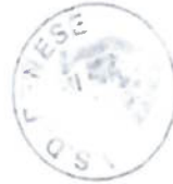
FIG.C. - L.R.D. - S.G.S. FEDERAZIONE PROVINCIALE DI CALCIO Savigliano, 11 - Tel. 011/2411166

PEDONA - RORETESE BLU BISALTA - MAGLIANO CARRU